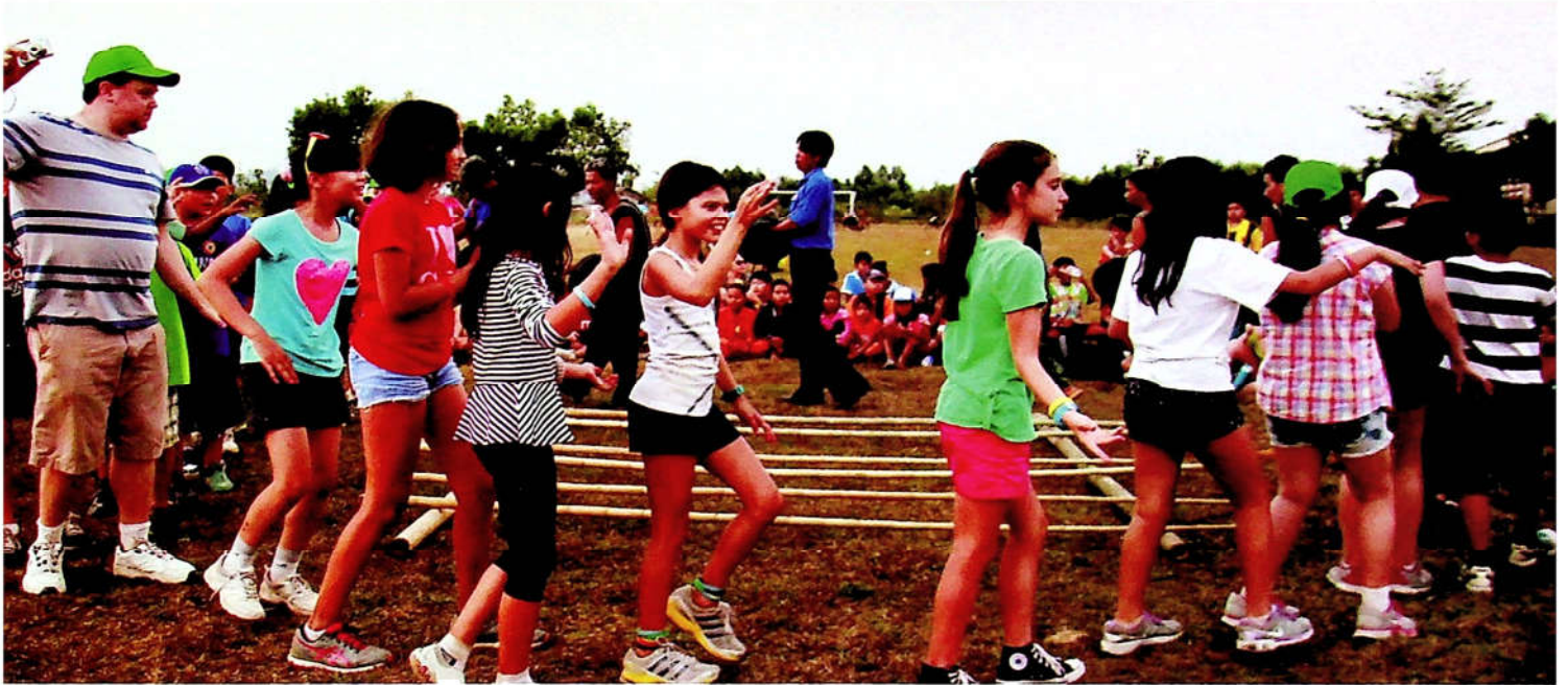
Sinh hoạt văn hóa ở Nhà Dài, Tà Lài, Cát Tiên