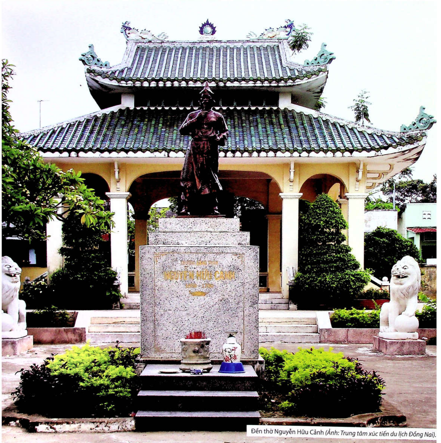
Đền thờ Nguyễn Hữu Cảnh (Ảnh: Trung tâm xúc tiến du lịch Đồng Nai).