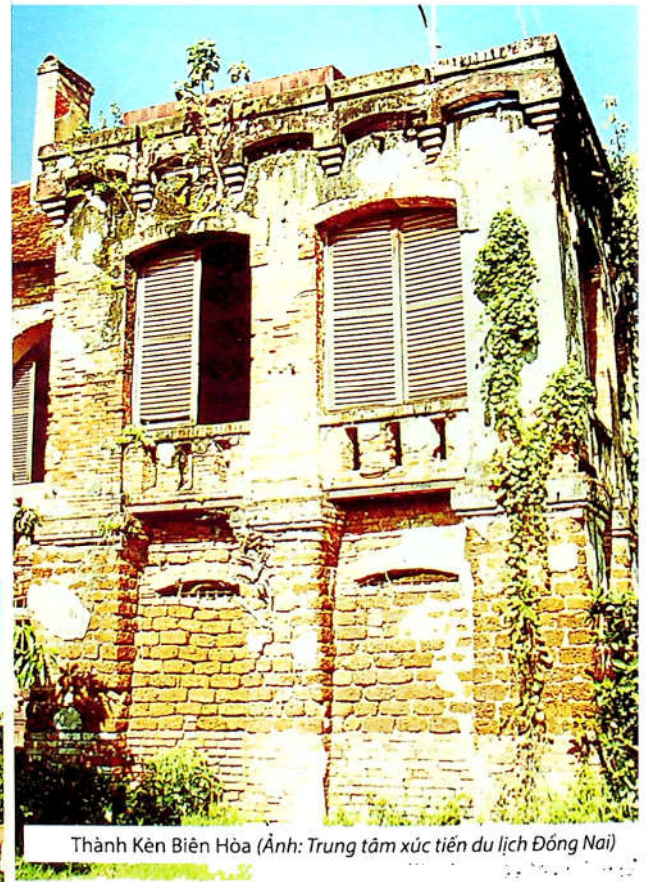
Thành Kèn Biên Hòa