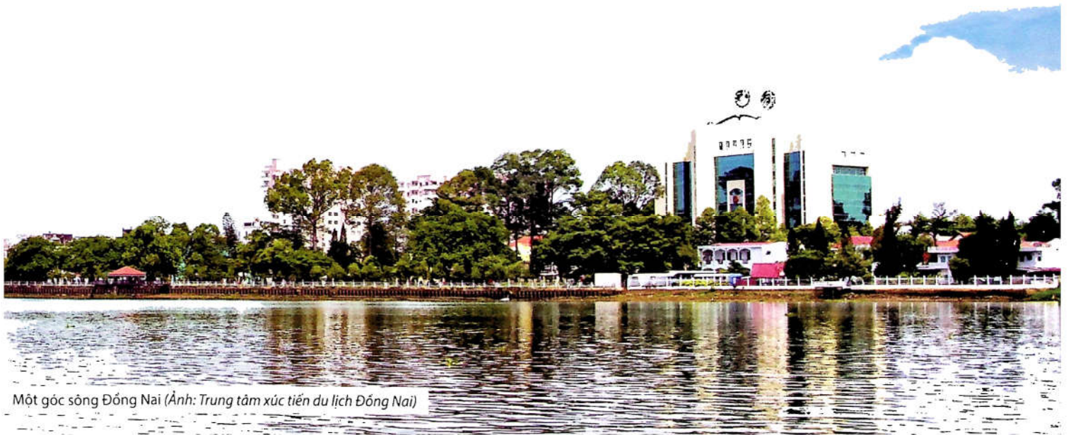
Một góc sông Đồng Nai