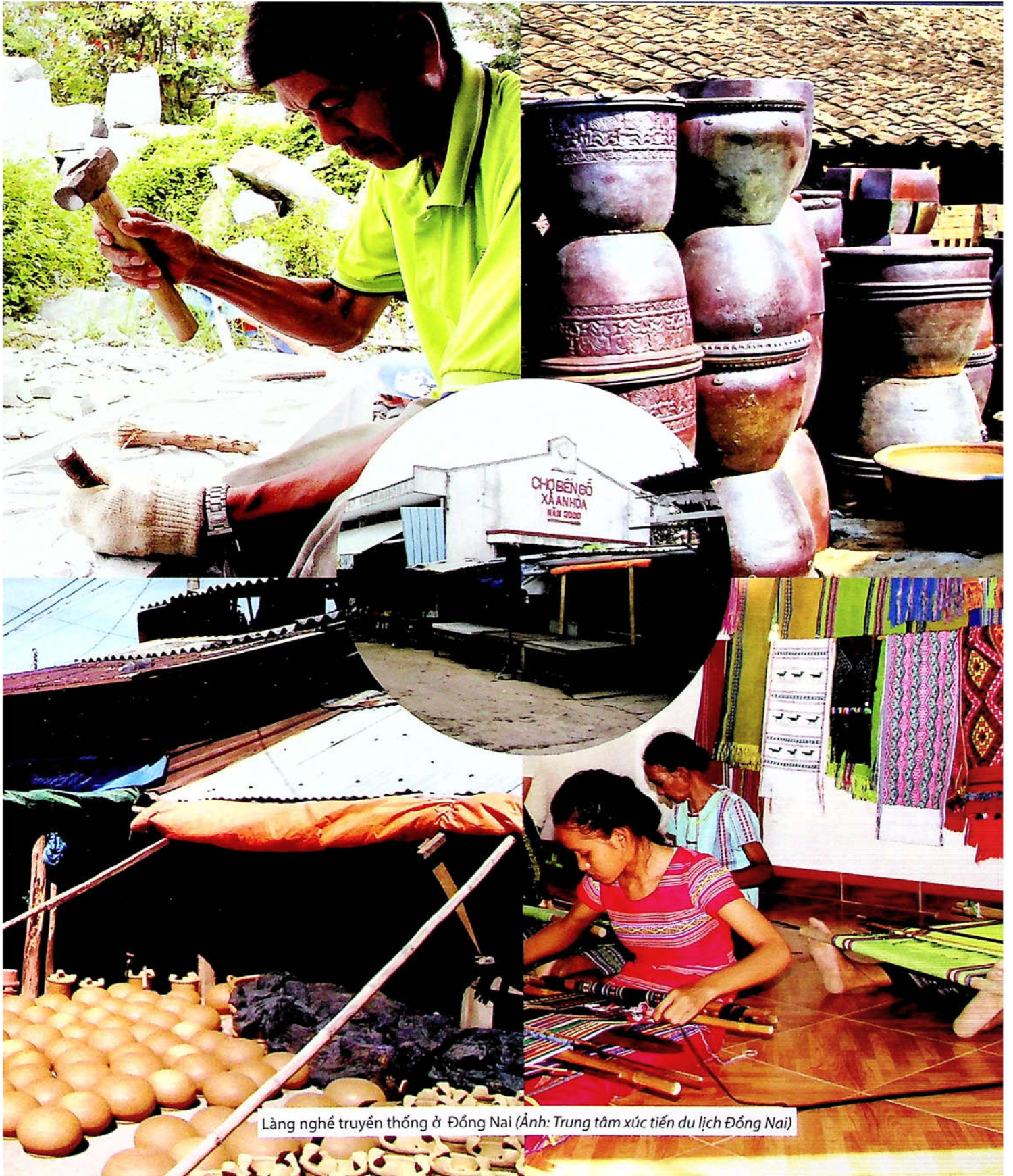
Làng nghề truyền thống ở Đồng Nai