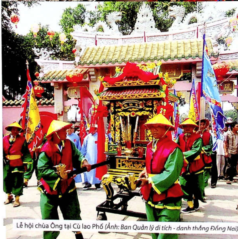
Lễ hội chùa Ông tại Cù lao Phố