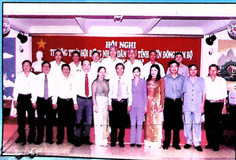
Đoàn Thường trực HĐND Tỉnh Đồng Nai với các đ/c lãnh đạo Ban quan hệ Đại biểu của Quốc Hội, Văn phòng Quốc hội Văn phòng Chính phủ, Văn phòng Bộ Nội Vụ.