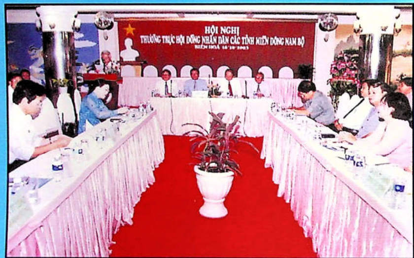
Quang cảnh Hội nghị Thường trực HĐND các Tỉnh miền Đông Nam bộ