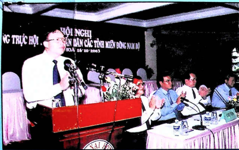
Giới thiệu Đại biểu