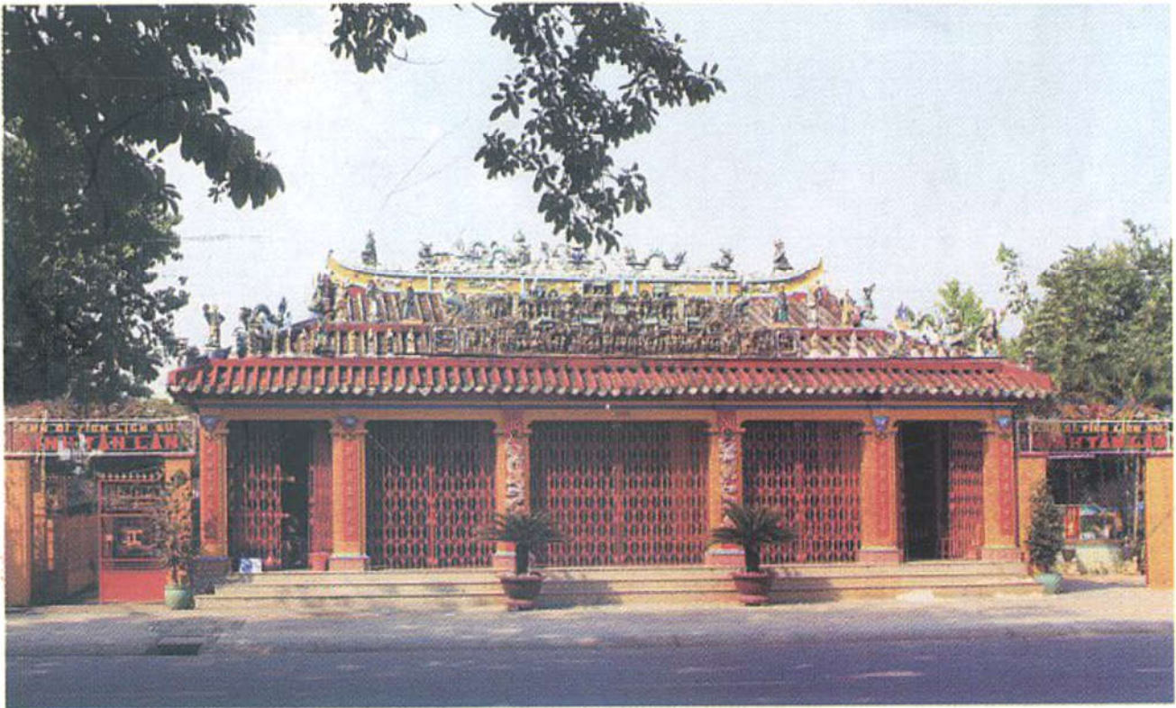
Đình Tân Lân (phường Hòa Bình).

Nơi thờ Trần Thượng Xuyên - Người có công lớn trong khai phá vùng đất Biên Hòa, đưa Cù lao Phố phát triển thành thương cảng Nông Nại Đại Phố vào thế kỷ XVII, XVIII