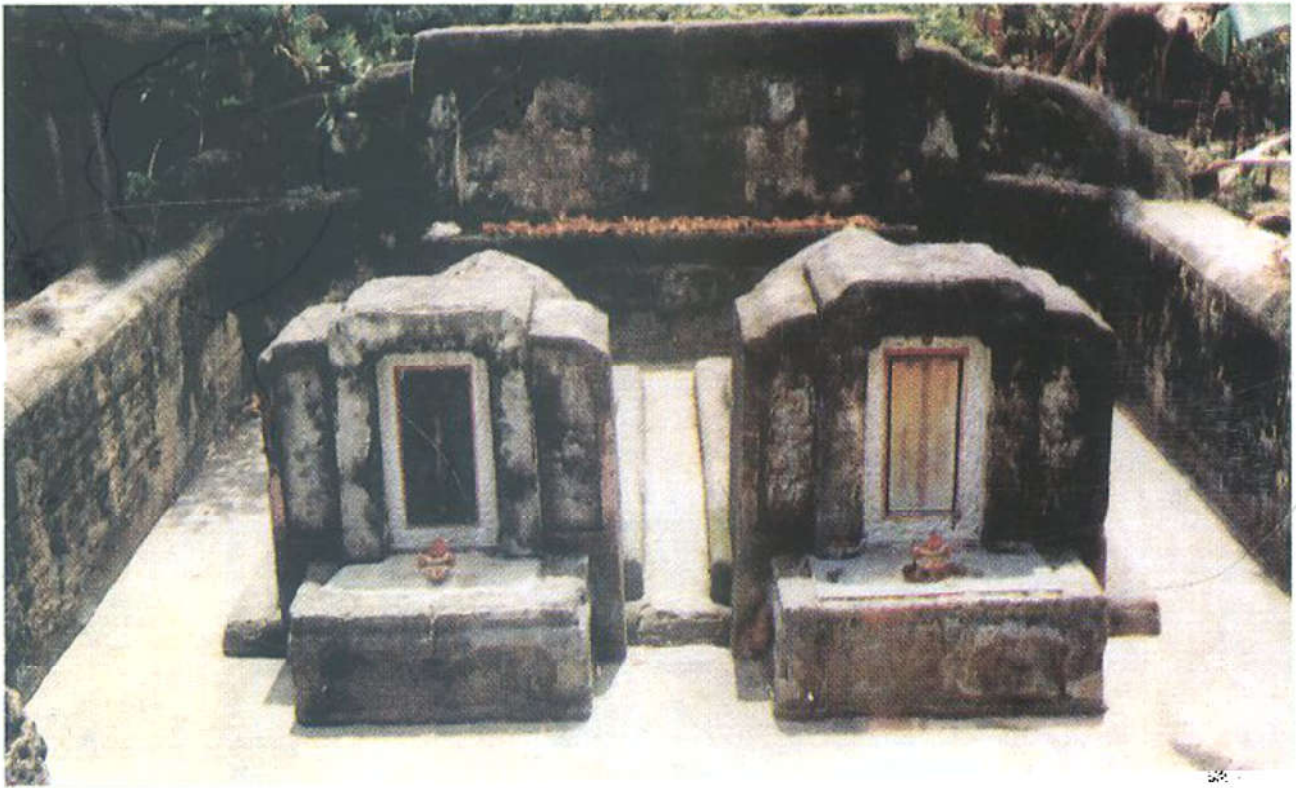
Lăng mộ Trịnh Hoài Đức (phường Trung Dũng) - Danh nhân Văn hóa xứ Đồng Nai. Tác giả bộ sách Gia Định thành thông chí - một công trình nghiên cứu giá trị về vùng đất Nam Bộ.