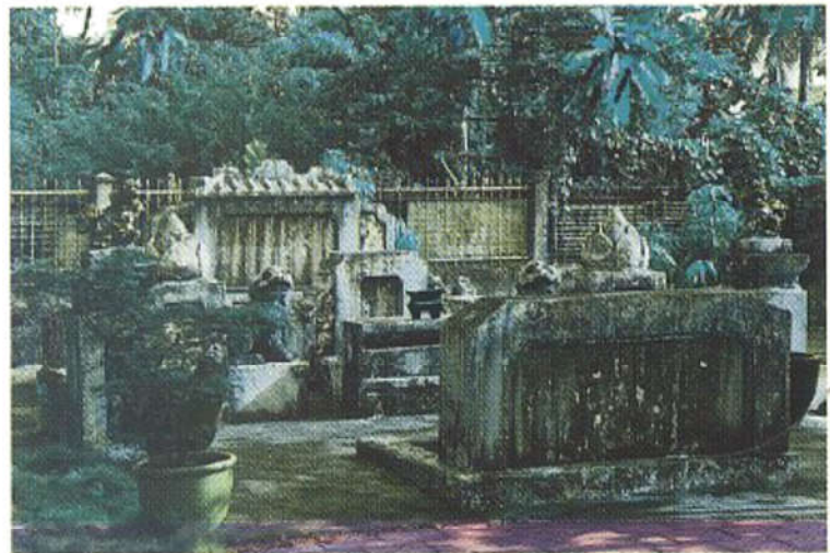
Lăng mộ thờ vọng Lê Thành Hầu Nguyễn Hữu Cảnh