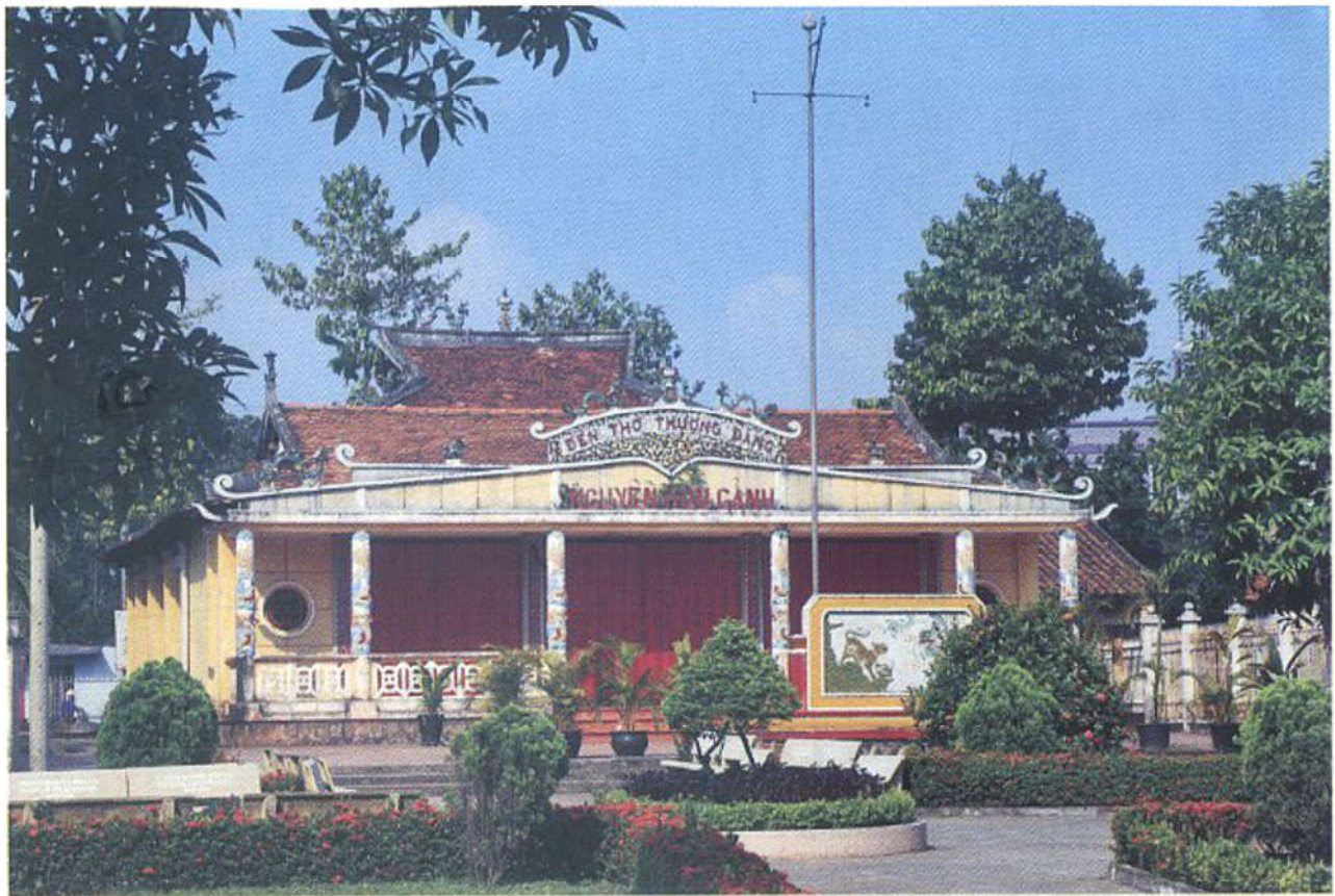
Đình Bình Kính - đền thờ Nguyễn Hữu Cảnh (xã Hiệp Hòa) Nơi thờ danh tướng Lê Thành Hầu Nguyễn Hữu Cảnh, người đặt nền hành chánh đầu tiên ở Nam Bộ