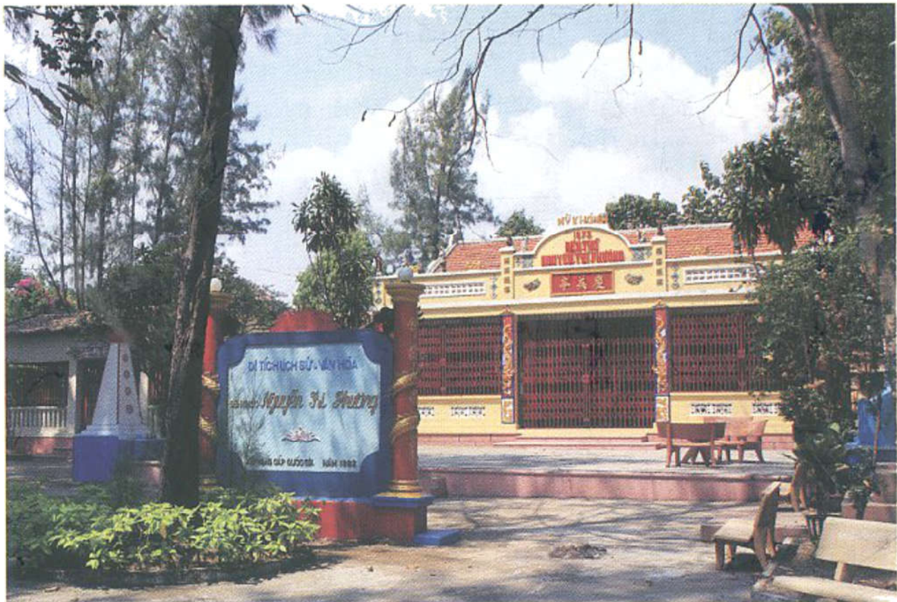
Tượng thờ Danh tướng Nguyễn Tri Phương

Đình Mỹ Khánh - đền thờ danh tướng Nguyễn Tri Phương phường Bửu Hòa. Người có công lớn trong việc chống Pháp tại vùng đất Biên Hòa - Gia Định vào thế kỷ XIX