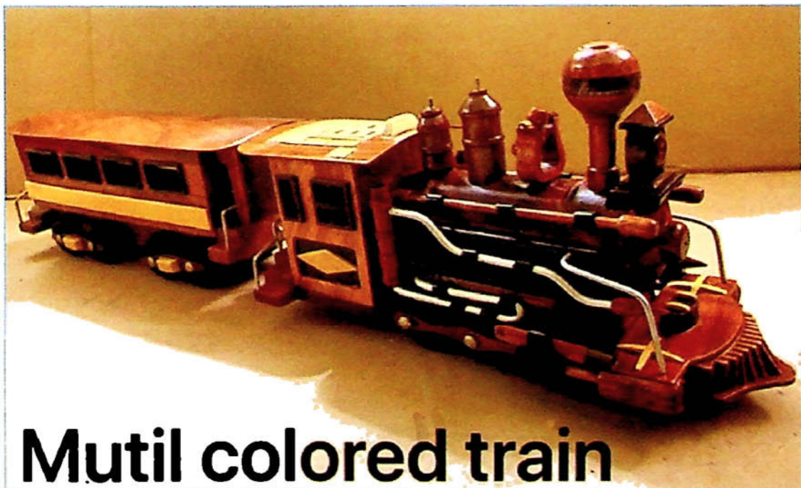
Mutil colored train

Đồ gỗ Thành Nhân chuyên cung cấp các sản phẩm gỗ mỹ nghệ, được làm chủ yếu từ các loại gỗ tự nhiên cao cấp như: gỗ cẩm lai, gỗ lọ nổi, gỗ mật (gỗ gụ), căm xe, cate, giáng hương, gỗ đỏ, và các loại gỗ nu... Trong đó sản phẩm “Xe lửa” của cơ sở Thành Nhân là một sản