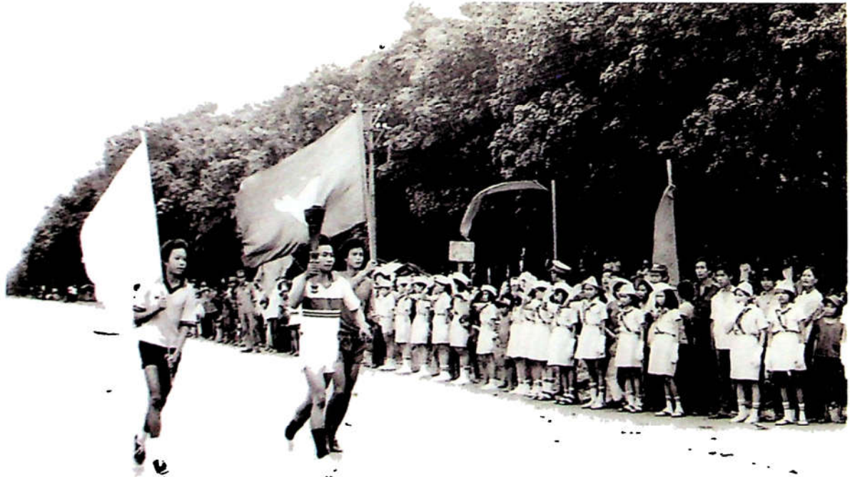
H3.30. Các vận động viên rước đuốc Hội khỏe Phù Đổng lần thứ hai.