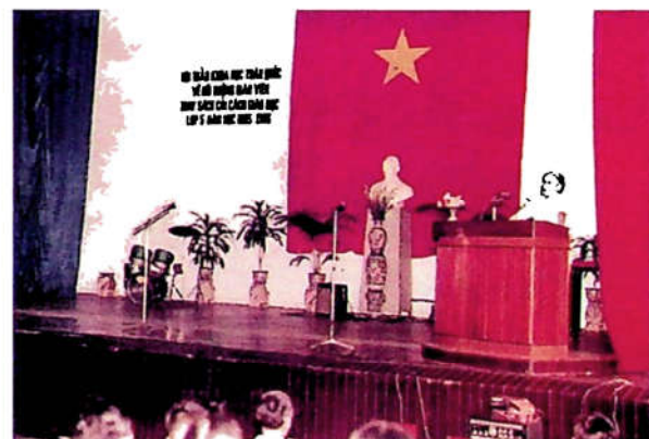
H3.12. Hội thảo khoa học về bồi dưỡng giáo viên cải cách giáo dục lớp năm