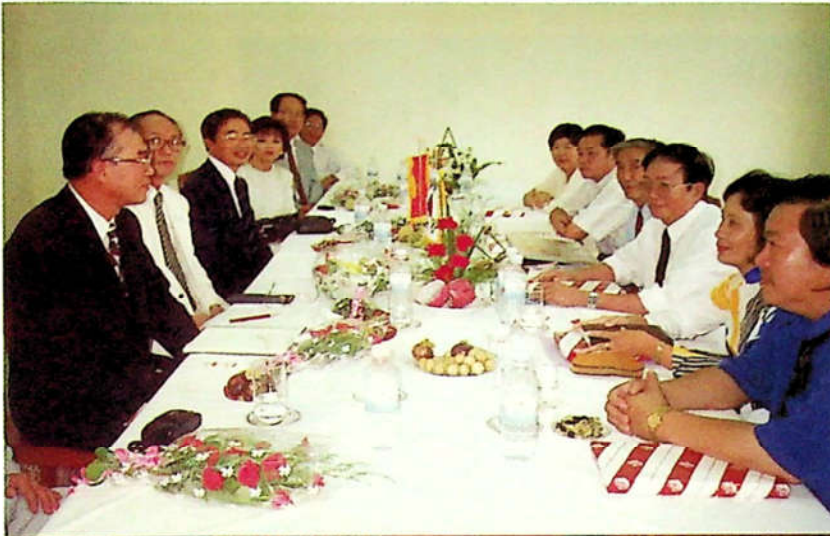
H3.48. Hội đàm giữa Lãnh đạo Sở GD-ĐT và Hội văn hóa hữu nghị Việt - Hàn. (Korean Association for International Relationship in Culture and Education)