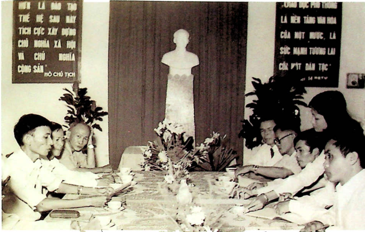
H3.44. Đón tiếp và làm việc với Đoàn đại biểu Bộ Giáo dục nước CHDCND Lào tại Văn phòng Ti Giáo dục Đồng Nai