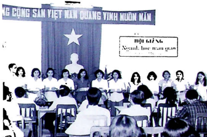
H3.10 Lễ tổng kết Hội giảng ngành học Mẫu giáo năm học 1983-1984.