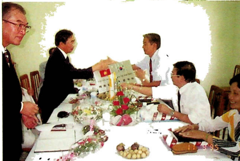
H3.50. Trao quà lưu niệm của Sở GD-ĐT và Hội văn hóa hữu nghị Việt - Hàn. (Souvenir Exchanging Ceremony)