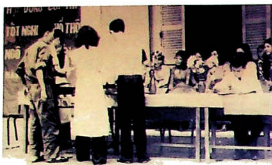
H3.3. Kỳ thi tốt nghiệp PTTH đầu tiên sau giải phóng tại Hội đồng thi Ngô Quyền TP. Biên Hòa