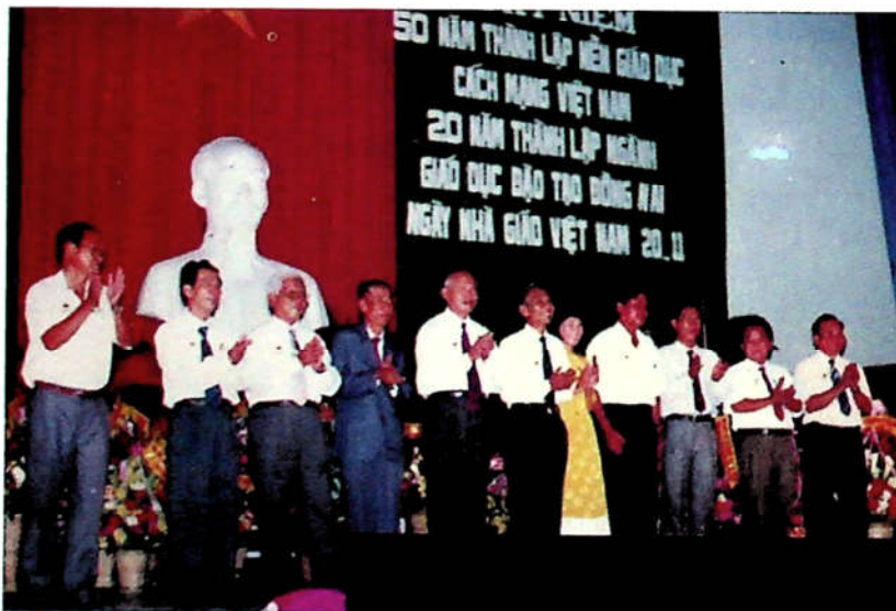
H3.14. Lễ kỉ niệm 50 năm thành lập nền giáo dục cách mạng Việt Nam, 20 năm thành lập ngành GD-ĐT Đồng Nai (20 – 11 – 1995).