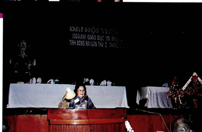
H3.15. Đại hội thi đua ngành GD - ĐT tỉnh Đồng Nai lần thứ nhất (Tháng 4 năm 2000).