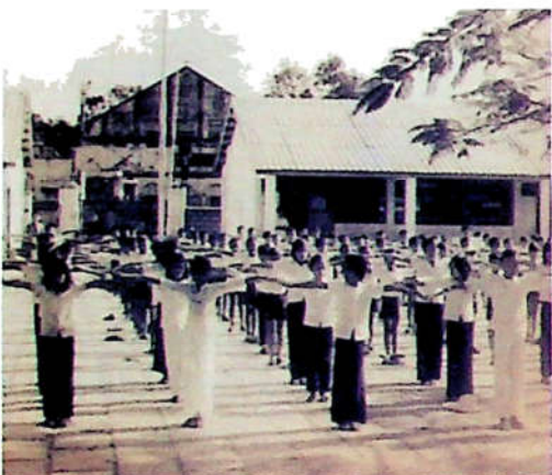
H3.5. Giờ tập thể dục của học sinh Trường Tiểu học Nguyễn Du, TP. Biên Hòa