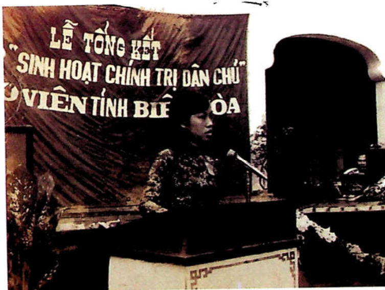
H3.2. Lễ tổng kết lớp "Sinh hoạt chính trị dân chủ" cho giáo viên tỉnh Biên Hòa tại trường Tiểu học Nguyễn Du tháng 7 - 1975.