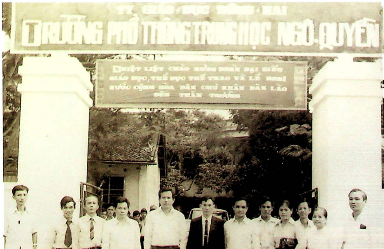
H3.45. Đón tiếp và làm việc với Đoàn đại biểu Bộ Giáo dục nước CHDCND Lào tại Trường PTTN Ngũ Quyển.