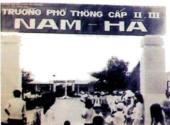
H3.7. Ngày nhập học đầu tiên của học sinh Trường phổ thông cấp 2 + 3 Nam Hà, TP. Biên Hòa.