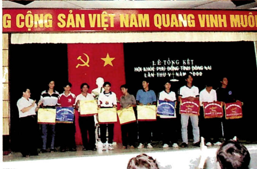
H3.33. Lễ tổng kết Hội khỏe Phù Đổng tỉnh Đồng Nai lần thứ năm.