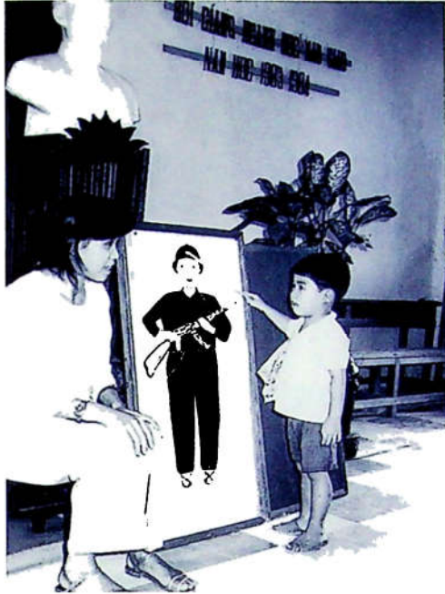
H3.9 Tiết hội giảng ngành học Mẫu giáo năm học 1983-1984.