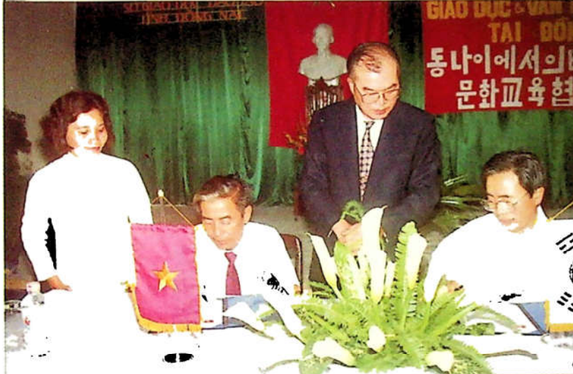
H3.49. Lễ kí kết hợp tác giữa Sở GD-ĐT Đồng Nai và Hội văn hóa hữu nghị Việt - Hàn. (Signing Ceremony)