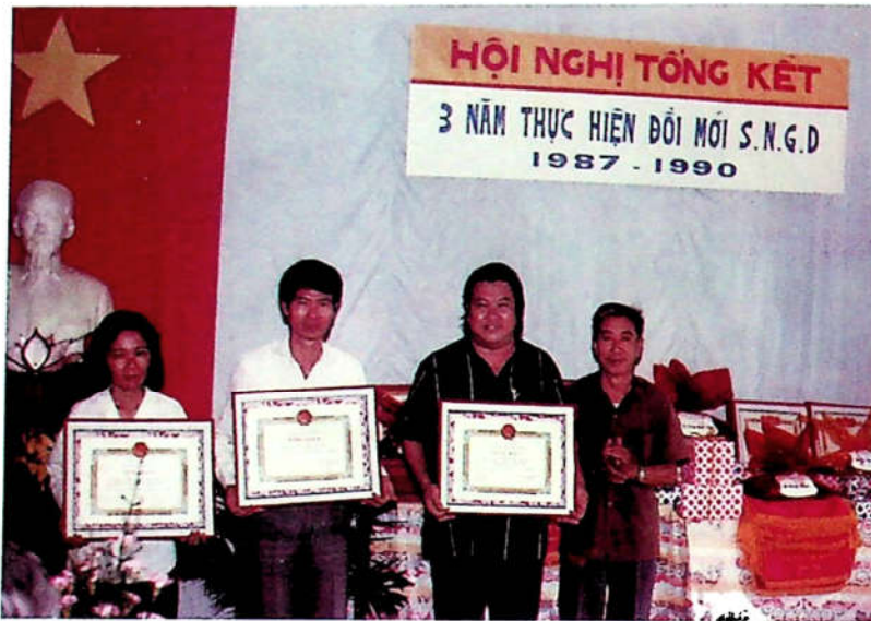
H3.13. Hội nghị Tổng kết 3 năm thực hiện đổi mới sự nghiệp giáo dục 1987 – 1990.