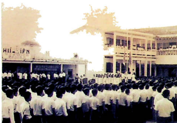
H3.6. Buổi sinh hoạt dưới cờ đầu tuần của học sinh PTTH Ngô Quyền, TP. Biên Hòa