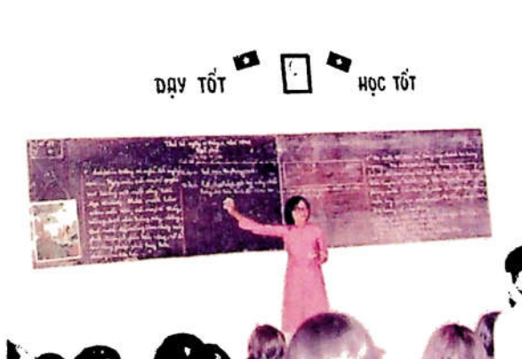
H3.11. Tiết Hội giảng chuyên đề sách giáo khoa cải cách ở cấp 1.