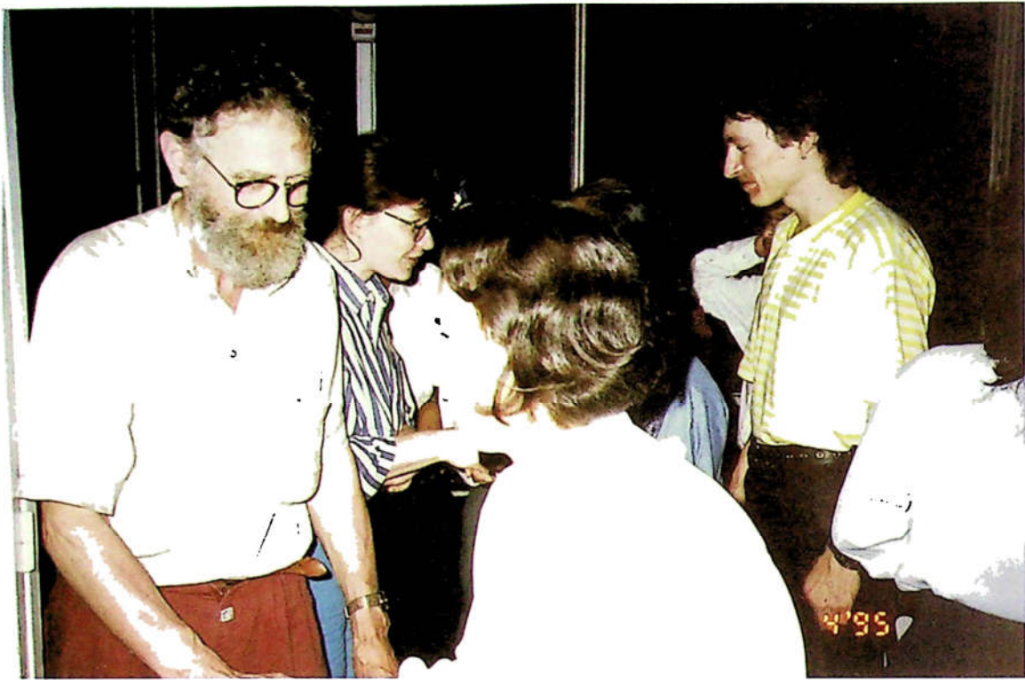
H3.46. Đoàn đại biểu tổ chức PPV của Công hòa Liên bang Đức làm việc với Sở GD-ĐT tỉnh Đồng Nai.