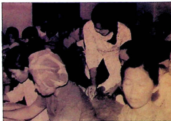
H3.8. Lớp học xóa mù chữ ban đêm tại huyện Long Thành.