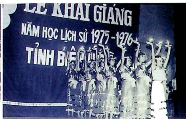
H3.4. Lễ khai giảng năm học đầu tiên sau giải phóng tại TP. Biên Hòa