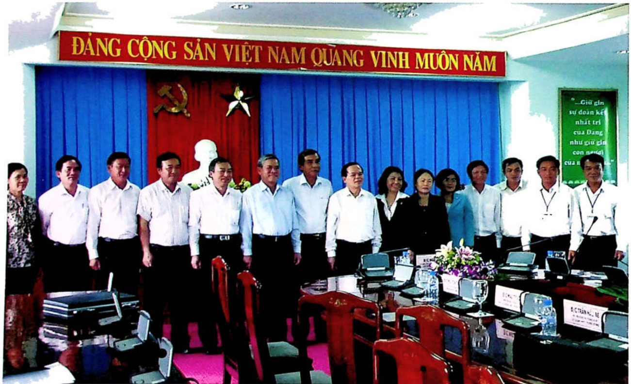
Đông chi Ngô Văn Dụ - Ủy viên Bộ Chính trị, Bí thư Trung ương Đảng, Chủ nhiệm UBKT Trung ương về làm việc với UBKT Tỉnh ủy.

Ngày 16/10/1948, đánh dấu mốc son 65 năm hình thành cơ quan chuyên trách kiểm tra đầu tiên của Đảng.