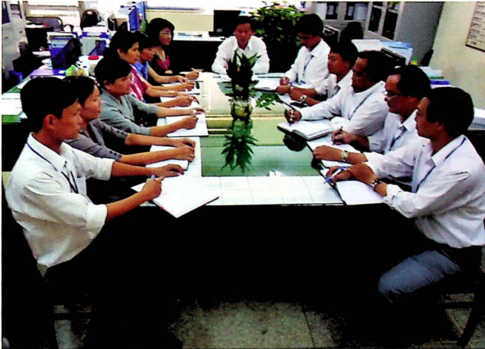
Một buổi sinh hoạt Văn phòng cơ quan UBKT Tỉnh ủy.

Sau năm 1976, cơ quan UBKT Tỉnh ủy - Ngành Kiểm tra Đảng của tỉnh nhà được hình thành. Trong những năm đầu, cán bộ, công chức cơ quan UBKT Tỉnh ủy rất ít (chỉ khoảng trên mười đồng chí). Từ những ngày đầu mới thành lập và trải qua nhiều nhiệm kỳ cho đến nay, cơ quan UBKT Tỉnh ủy hoạt động theo chế độ chuyên viên, kiểm tra viên và có tổ chức bộ phận Văn phòng. Bộ phận này đảm nhiệm các công tác hành chính - tổng hợp, tham mưu cho UBKT Tỉnh ủy trong việc phân tích, đánh giá các số liệu trong công tác kiểm tra, giám sát và thi hành kỷ luật đảng.