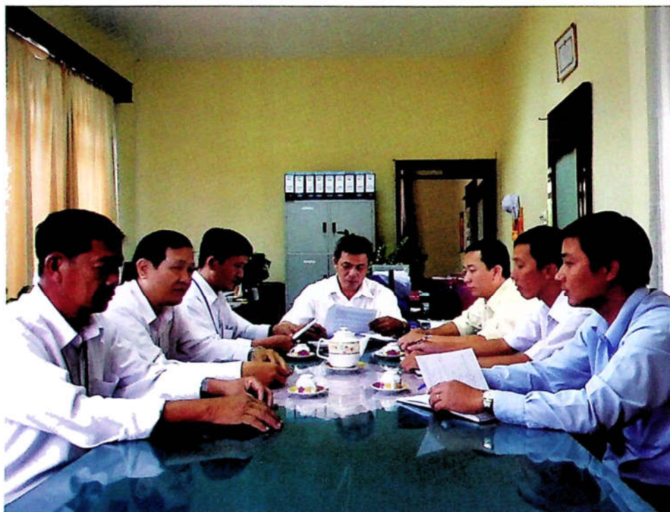
Bàn các công tác chuyên môn ở Phòng Nghiệp vụ 1.

(Phòng Nghiệp vụ 1, cơ quan UBKT Tỉnh ủy)