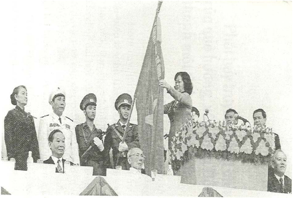
Tỉnh Đồng Nai tổ chức trọng thể lễ đón nhận danh hiệu Anh hùng LLVTND do Chủ tịch nước phong tặng.