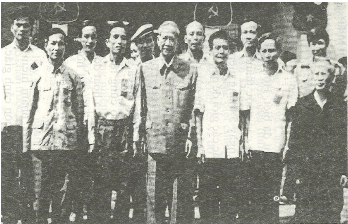
Tổng Bí thư Lê Duẩn chụp ảnh lưu niệm với các đại biểu dự Đại hội Đảng bộ tỉnh Đồng Nai lần thứ III.

Trong kháng chiến chống Mỹ cứu nước, trên chiến trường miền Đông “gian lao mà anh dũng” Đồng Nai là một mảnh đất kiên cường mà biết bao khu rừng, ngọn núi khúc sông đã trở thành tên gọi của nhiều chiến công lừng lẫy. Trong giai đoạn mới hòa nhịp với bước phát triển của cách mạng miền Nam sau ngày giải phóng, tỉnh Đồng Nai đã iến được một bước đáng kể trên con đường xã hội chủ nghĩa.