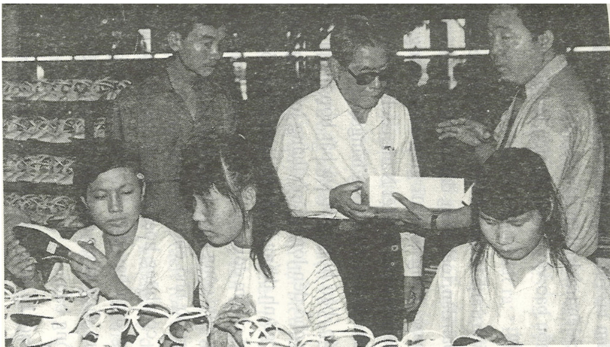
Đ/c Tổng Bí thư Nguyễn Văn Linh thăm Công ty cao su màu Đồng Nai (CASUM)

thôn bao vây thành thị tiến lên giải phóng thành thị.