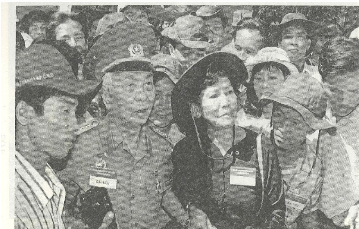
Đại tướng Võ Nguyên Giáp trong vòng tay nhân dân Đồng Nai.