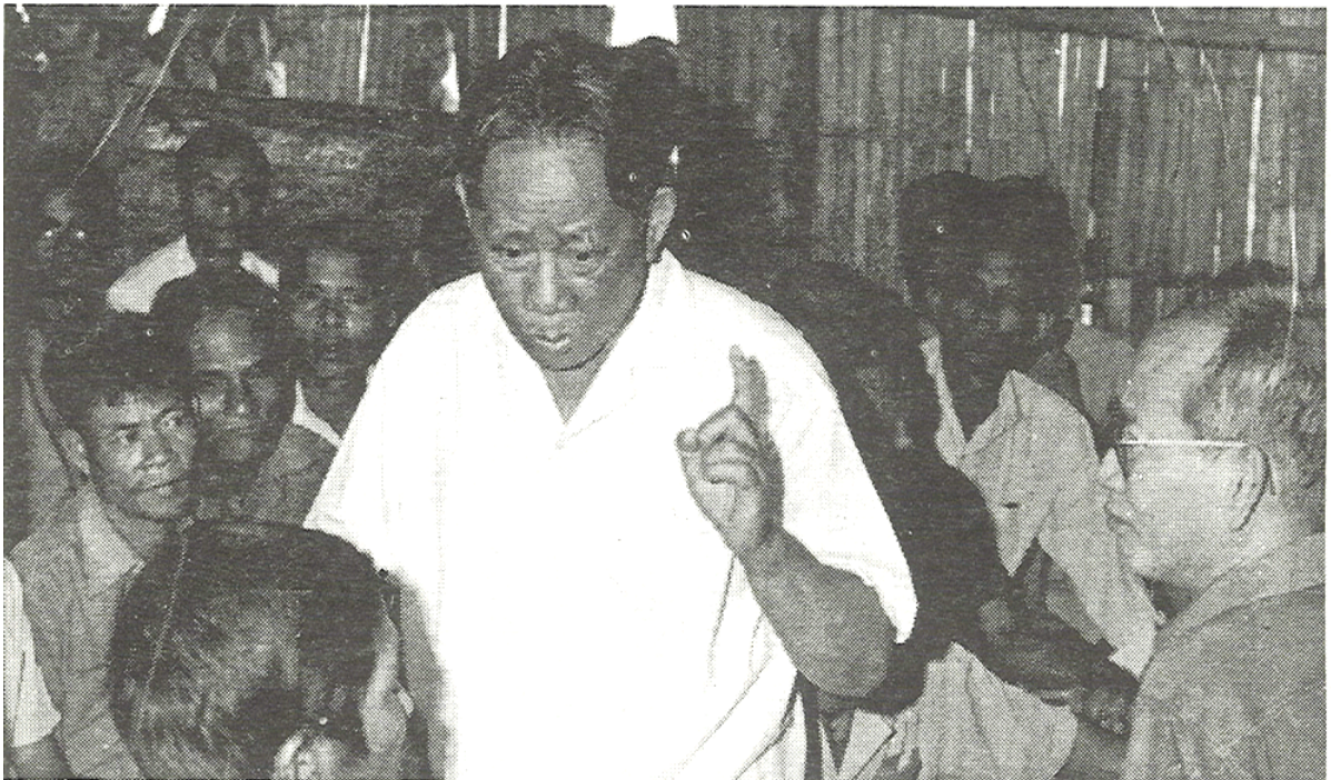
Tổng Bí thư Lê Duẩn thăm và nói chuyện với đồng bào dân tộc Châu Ro tỉnh Đồng Nai.

Nghề cá của Đồng Nai tuy hiện nay sản lượng chưa nhiều, nhưng có triển vọng rất lớn, nhờ có bờ biển tương đối dài diện tích nước mặn, nước lợ khá rộng, có những kinh nghiệm phong phú về nuôi trồng, đánh bắt hải sản, thủy sản và kinh nghiệm khai thác vùng ven biển. Phải coi ngành này là một trọng điểm cần đầu tư thích đáng đặc biệt ưu tiên đầu tư cho việc nuôi trồng thủy sản phục vụ xuất khẩu.