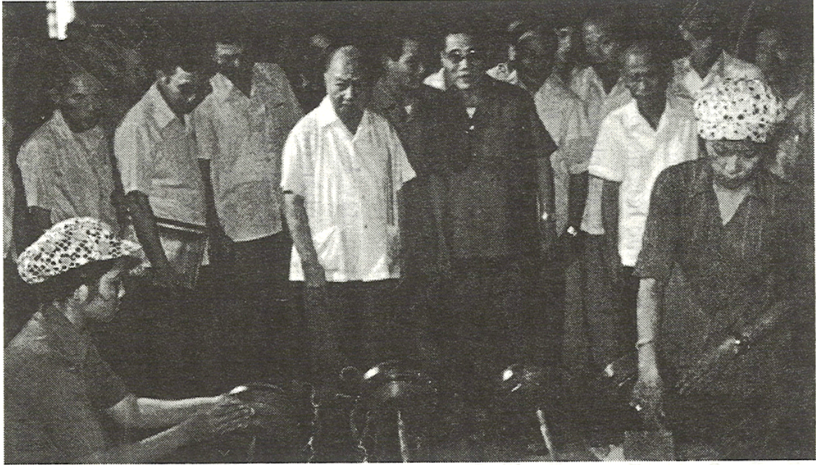
Chủ tịch nước Trường Chinh thăm Nhà máy Điện cơ Đồng Nai.