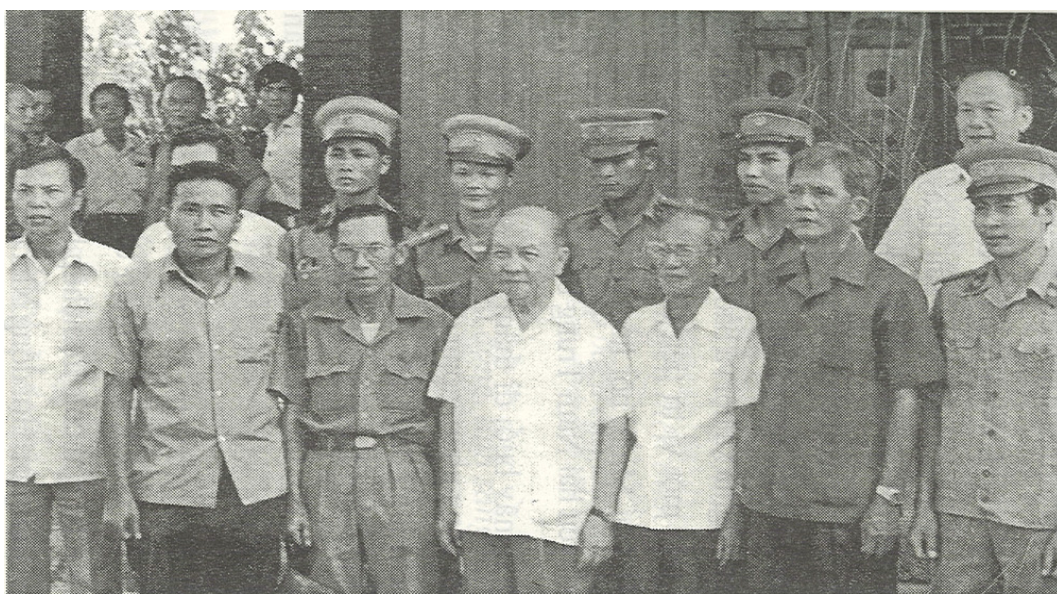
Chủ tịch Hội đồng nhà nước Trường Chinh với Công an Đồng Nai.

Nhân dịp này, tôi xin gửi tới toàn thể cán bộ, đảng viên, chiến sĩ và nhân dân trong tỉnh lời thăm hỏi ân cần của Ban chấp hành Trung ương Đảng, Quốc hội, Hội đồng Nhà nước và Hội đồng Bộ trưởng. Tôi cũng xin chuyển tới anh chị em thương binh, bệnh binh, các gia đình liệt sĩ, gia đình có công với cách mạng, các cán bộ hoạt động lâu năm ở Đồng Nai những tình cảm thăm thiết nhất.