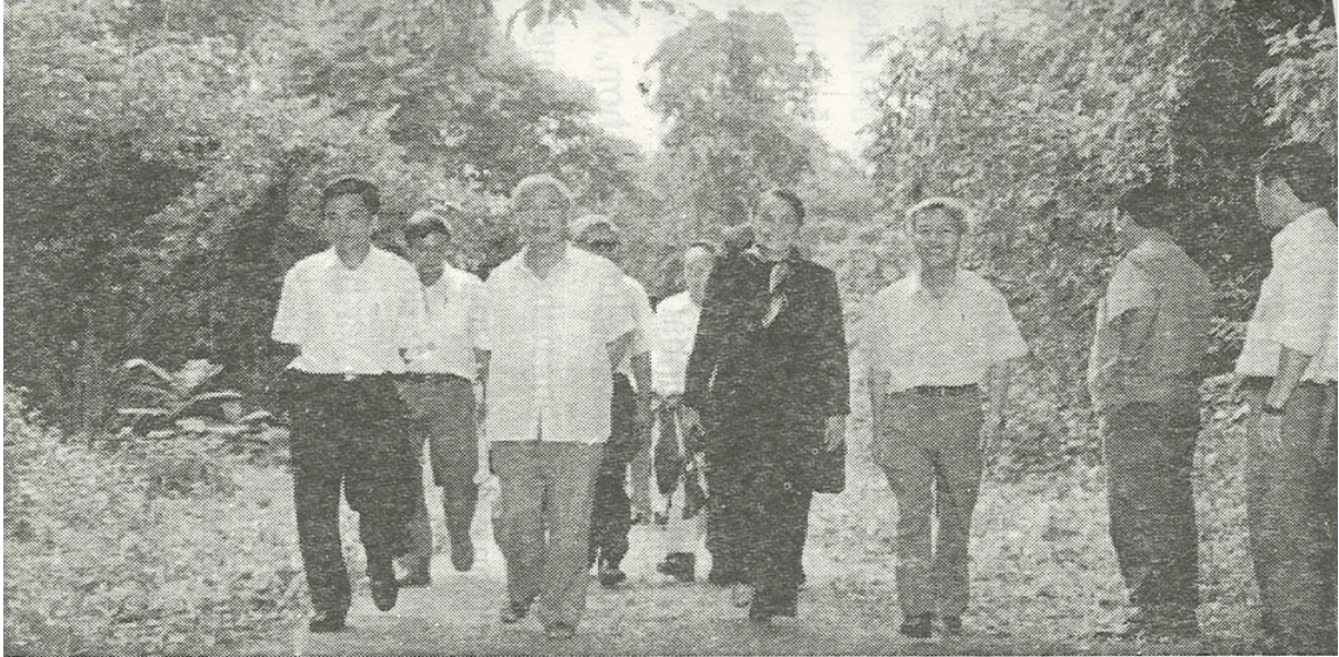
Tổng bí thư Đỗ Mười và các đồng chí lãnh đạo tỉnh thăm vườn quốc gia Nam Cát Tiên.