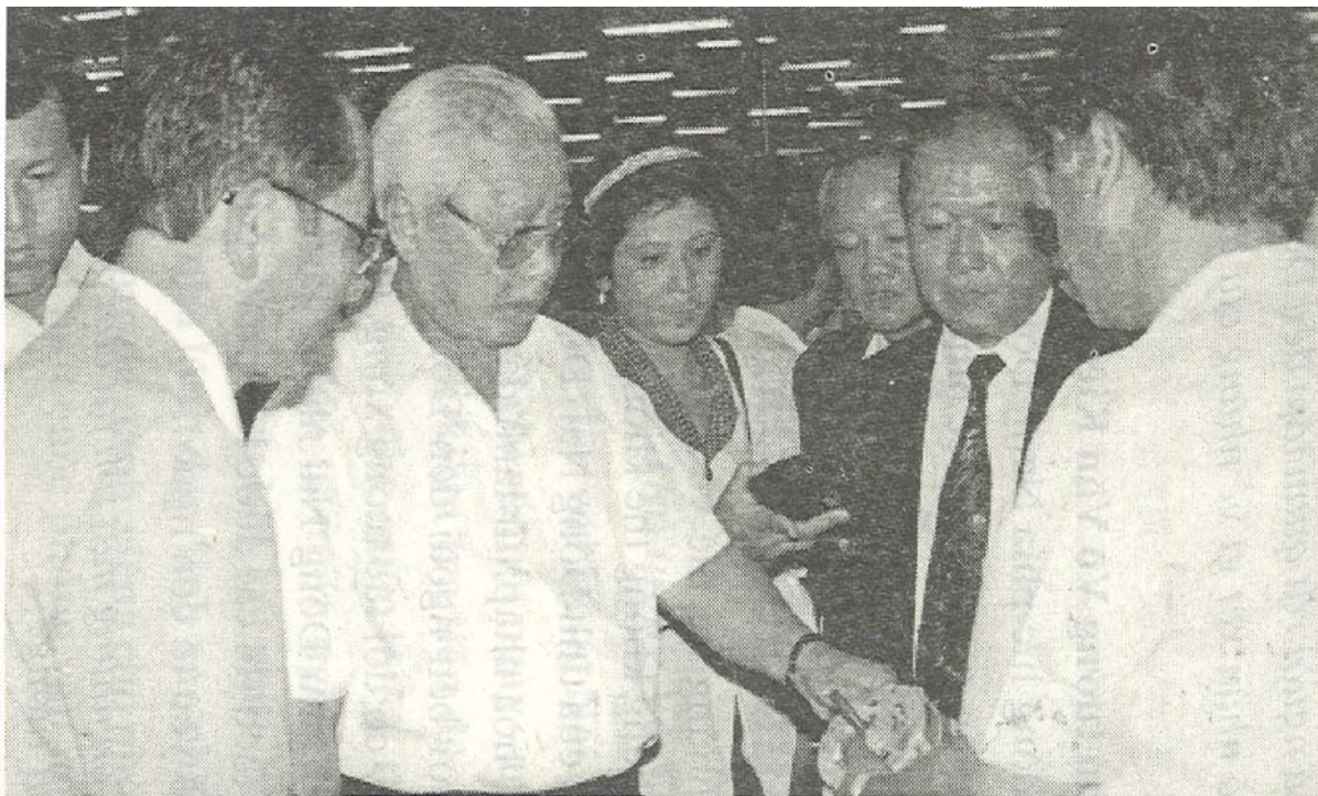
Thủ tướng Võ Văn Kiệt thăm công ty SANYO - Việt Nam, khu công nghiệp Biên Hòa II.

- Thủ tướng Võ Văn Kiệt: Nằm trong vùng kinh tế động lực phía Nam, Đồng Nai đang trên đà phát triển. Cùng với việc hình thành các KCN, ngoài Biên Hòa, các huyện Long Thành, Nhơn Trạch... đang đô thị hóa dần dần gắn với TP.HCM, Bà Rịa - Vũng Tàu. Dĩ nhiên Đồng Nai có những lợi thế về hạ tầng, KCN mới hấp dẫn... nhưng không thể không đề cập đến vai trò lãnh đạo của tỉnh Đồng Nai. Đó là sự năng động, đổi mới, hòa nhập; từ lãnh đạo đến cán bộ, làm cho người bên ngoài đến Đồng Nai làm ăn họ cảm thấy có đối tác tương xứng. Cũng có nơi có điều kiện như Đồng Nai nhưng làm chưa được. Do vậy theo tôi cái được lớn nhất của Đồng Nai thuộc về yếu tố con người.