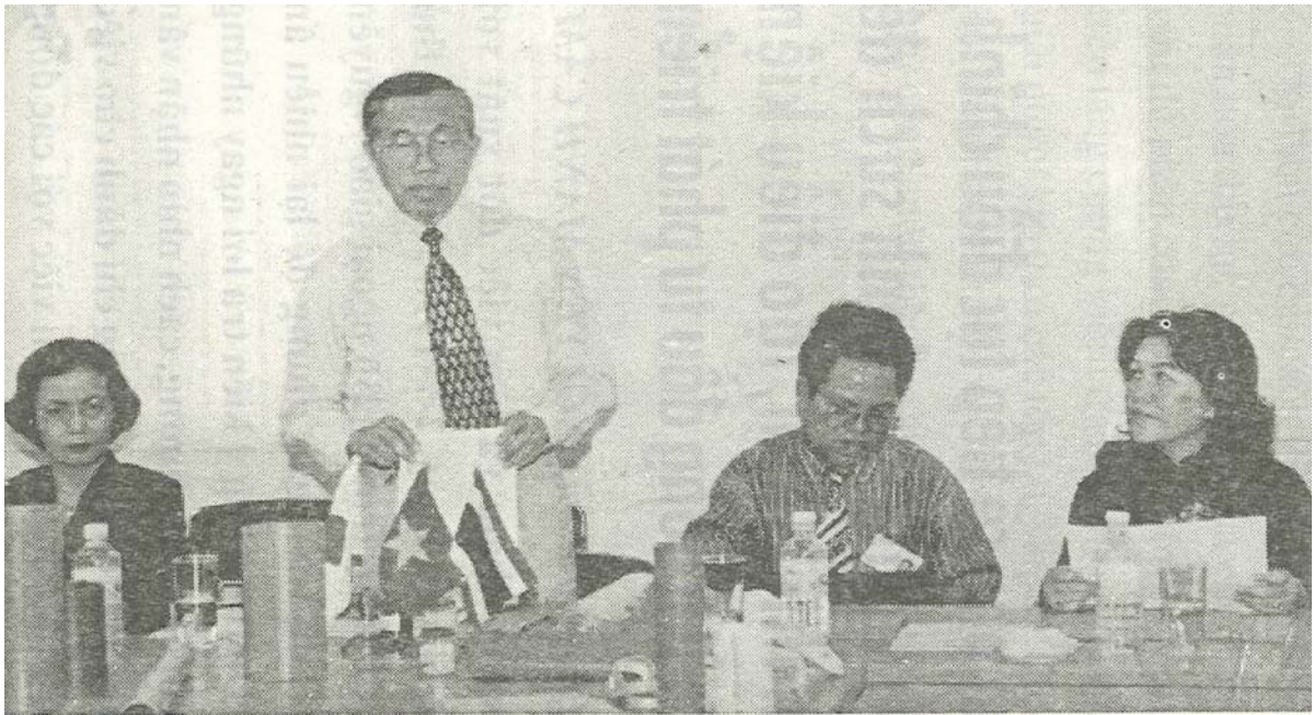
Phó thủ tướng Nguyễn Mạnh Cẩm thăm và nói chuyện với doanh nghiệp có vốn đầu tư nước ngoài.

khẩn bao giờ cũng chỉ là tạm thời. Tôi đồng ý với cách nhìn nhận, đánh giá tình hình của Đồng Nai. Ngoài những khó khăn khách quan chưa thể lường hết được, nhưng những khó khăn từ phía chúng ta thì phải tìm cách khắc phục để hạn chế.