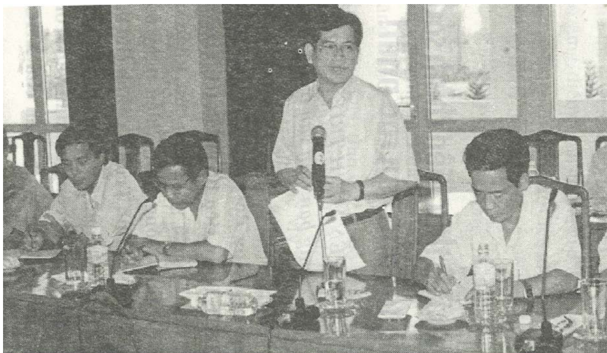
Đ/c Nguyễn Minh Triết, Ủy viên Bộ chính trị, Trưởng ban Dân vận TW vào thăm và làm việc với Đồng Nai.