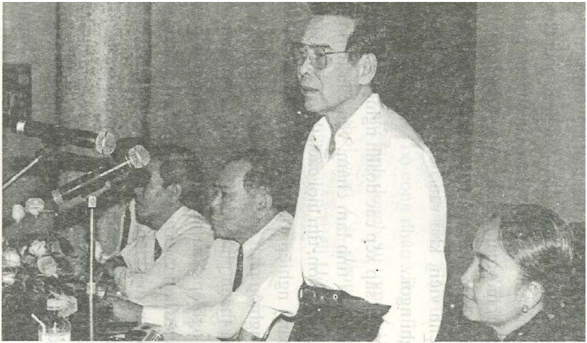
Thủ tướng Phan Văn Khải trong buổi làm việc với Công ty cao su Đồng Nai nhân kỷ niệm 100 năm ngành cao su Việt Nam.