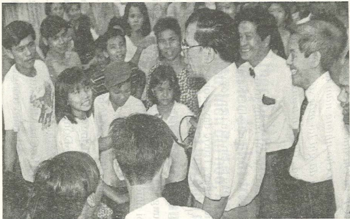
Đ/c Nông Đức Mạnh, Chủ tịch Quốc hội thăm hỏi nhân dân và các em thiếu nhi ở phường Bình Đa, Biên Hòa.

Đồng Nai là vùng đất có truyền thống anh hùng trong hai cuộc kháng chiến giành độc lập, tự do cho dân tộc. Trong sự nghiệp xây dựng và phát triển đất nước, Đồng Nai là tỉnh có vị trí tương đối đặc biệt. Về địa lý, là một tỉnh rất thuận, cạnh thành phố Hồ Chí Minh, trên trục đường về Vũng Tàu..., là tỉnh nằm trong khu vực kinh tế trọng điểm của vùng và cả nước. Tự thân Đồng Nai cũng có nhiều lợi thế để phát triển kinh tế, đặc biệt phát triển lĩnh vực công nghiệp. Ngoài ra, còn lợi thế về giao thông (có đường bộ, đường sắt, đường sông, đường hàng không...); lợi thế về đất đai trù phú và màu mỡ, đáp ứng đủ loại hình cây trồng, vật nuôi... Có thể nói là nhiều tiềm năng lớn. Nếu biết khai thác, sử dụng thì Đồng Nai không chỉ làm giàu cho bản thân tỉnh nhà mà còn góp phần làm giàu cho nền kinh tế cả nước.