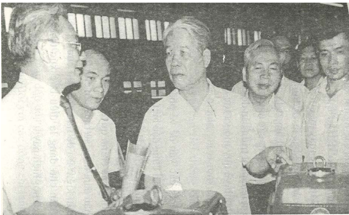
Đ/c Tổng bí thư Đỗ Mười thăm Nhà máy Vinapro.

Về thực hiện nhiệm vụ cổ phần hóa doanh nghiệp Nhà nước, Cố vấn Đỗ Mười lưu ý tỉnh và các doanh nghiệp "phải quán triệt mục tiêu cổ phần hóa theo định hướng XHCN, nhằm đạt được yêu cầu: đổi mới công nghệ, phương tiện sản xuất; kêu gọi cổ phần để tạo vốn làm ăn có lãi chứ không phải cổ phần là tư nhân hóa 100%, làm được bao nhiêu đem chia hết cho cổ đông không còn tích lũy để tái đầu tư phát triển sản xuất, kinh doanh..."