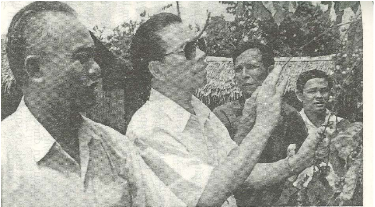
Đ/c Nông Đức Mạnh, Chủ tịch Quốc hội thăm vườn cà phê của nông dân ở xã Xuân Bảo, Long Khánh.