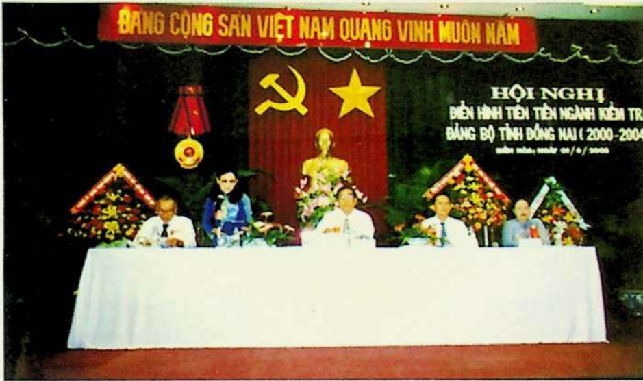
Hội nghị điển hình tiên tiến ngành kiểm tra Đảng bộ tỉnh Đồng Nai (2000 - 2004).

42 năm qua, dưới sự lãnh đạo, chỉ đạo của Tỉnh ủy, Ban Thường vụ Tỉnh ủy, tổ chức UBKT các cấp được cấp ủy quyết định thành lập, củng cố kiện toàn và không ngừng lớn mạnh. Đến nay, toàn Đảng bộ tỉnh đã có 17/17 UBKT cấp huyện (tương đương) với 115 ủy viên (có 81 chuyên trách); có 756 tổ chức cơ sở đảng (trong đó 387 đảng bộ cơ sở) đã tổ chức bầu cử, phân công làm công tác kiểm tra với 1.724 ủy viên UBKT Đảng ủy cơ sở và hàng ngàn chi ủy viên, đảng viên phụ trách kiểm tra. Toàn tỉnh đã có trên 5.900 cán bộ kiểm tra.