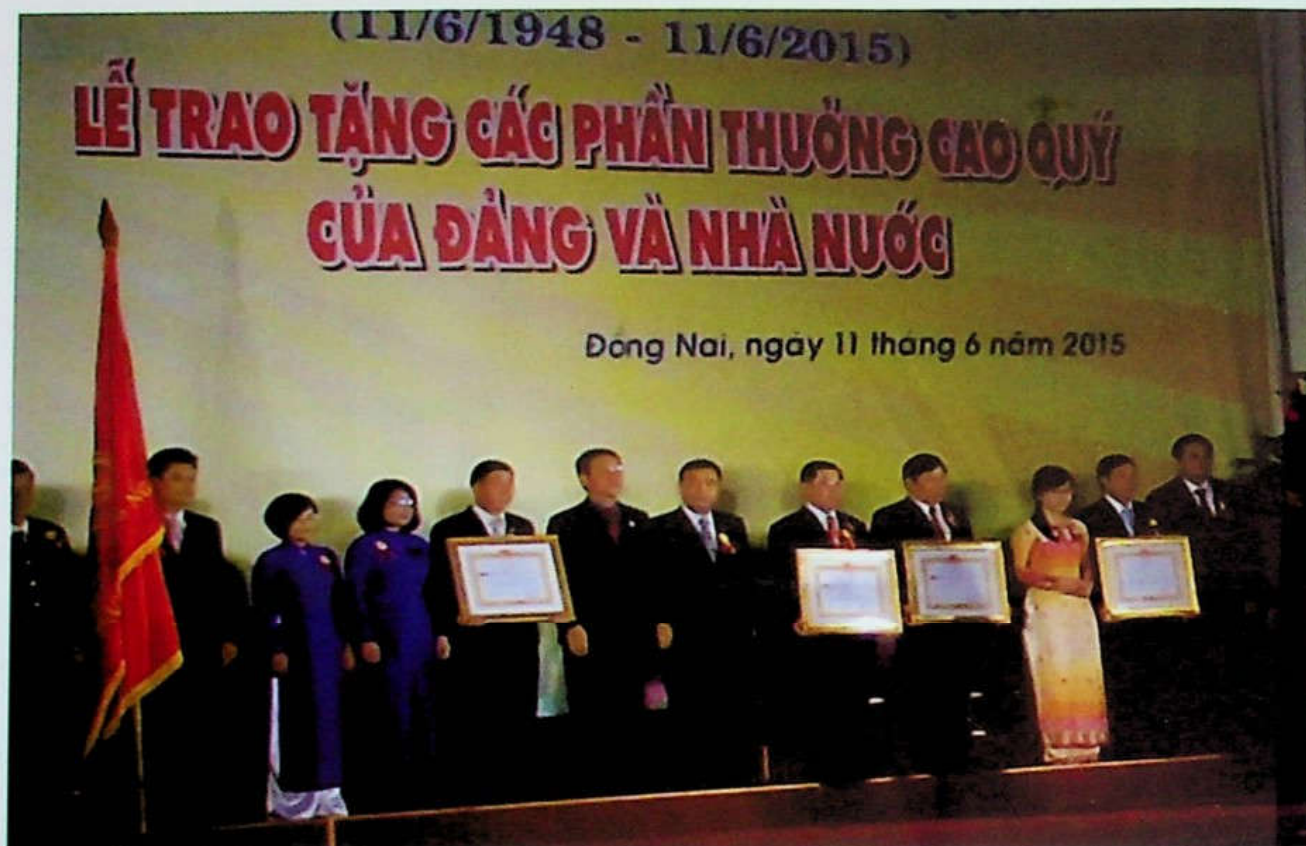
UBKT Tỉnh ủy nhận Huân chương Lao động hạng Nhì, năm 2015.

làm, tham ô, hối lộ...; thu hồi nộp vào ngân sách Nhà nước 6.659.733.900 đồng (do vi phạm nguyên tắc tài chính), số tài sản trị giá 517.540.000 đồng và hàng ngàn mét vuông đất các loại, giải quyết quyền lợi hợp pháp chính đáng của người dân không để xảy ra bức xúc, gây bất ổn xã hội; cảnh báo, ngăn chặn những biểu hiện suy thoái về tư tưởng chính trị đạo đức lối sống của hơn 4.000 cán bộ, đảng viên, góp phần giáo dục, rèn luyện đội ngũ cán bộ, đảng viên nêu cao tính tiên phong, gương mẫu trong sinh hoạt và thực thi nhiệm vụ, giảm dần tỷ lệ đảng viên vi phạm bị xử lý kỷ luật trong từng thời kỳ (1) .