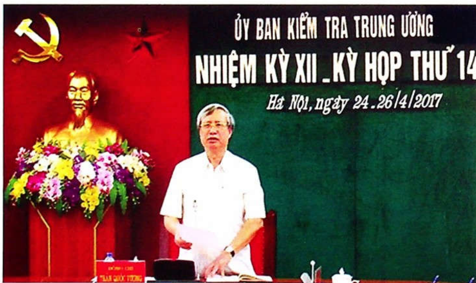
Đồng chí Trần Quốc Vương phát biểu tại cuộc họp UBKT Trung ương, ngày 24-26/04/2017.

Nghị quyết Trung ương 4 khóa XII của Đảng xác định "Tình trạng suy thoái về tư tưởng chính trị, đạo đức, lối sống của một bộ phận không nhỏ cán bộ, đảng viên chưa bị đẩy lùi, có mặt, có bộ phận còn diễn biến tinh vi, phức tạp hơn; tham nhũng, lãng phí, tiêu cực vẫn còn nghiêm trọng, tập trung vào số đảng viên có chức vụ trong bộ