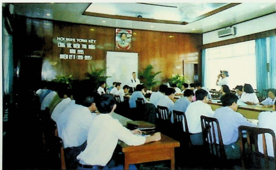
Hội nghị tổng kết công tác kiểm tra, giám sát năm 1995 (nhiệm kỳ 1990 - 1995).

Cơ quan kiểm tra chuyên trách đầu tiên của Đảng ra đời vào ngày 16/10/1948, Ban Kiểm tra nay là UBKT các cấp đã không ngừng được củng cố và phát triển, hình thành một hệ thống từ Trung ương đến các đảng bộ cơ sở, với đội ngũ cán bộ không ngừng được củng cố kiện toàn số lượng và chất lượng.