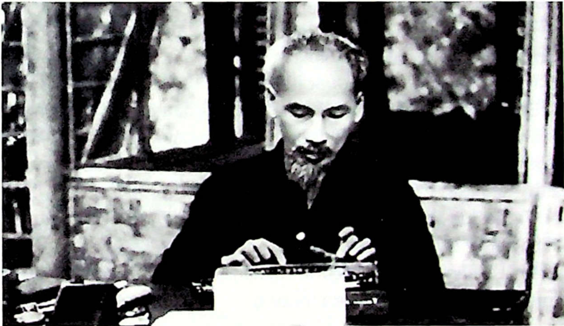
Từ chiếc máy chữ này của Hồ Chủ tịch đã ra đời nhiều văn kiện liên quan đến vận mệnh đất nước.

Vấn đề Dân vận nói đã nhiều, bàn đã kỹ nhưng vì nhiều địa phương, nhiều cán bộ chưa hiểu thấu, làm chưa đúng, cho nên cần phải nhắc lại.