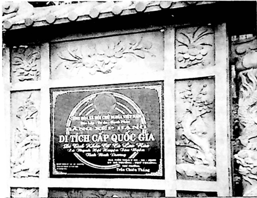
Di tích khảo cổ cù lao Rùa

Washington, nơi ghi tên 58.198 lính Mỹ chết trận ở Việt Nam. Phía bên ngoài làng Gò Me là trường Bá nghệ Biên Hòa, tiền thân một trăm năm của trường Cao đẳng Mỹ thuật Trang trí Đồng Nai ngày nay, nơi tôi từng theo học. Đối diện bên kia đường là Đài kỷ niệm Biên Hòa được thực dân Pháp xây dựng năm 1924, để ghi nhận cái gọi là “chiến công” của những thanh niên Việt Nam bị Pháp bắt đi làm bia đỡ đạn trong chiến tranh Pháp - Phổ hồi đầu thế kỷ XX.