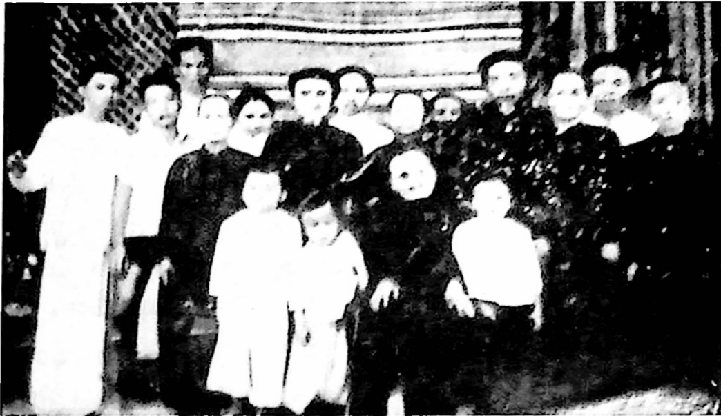
Gia tộc họ Dương