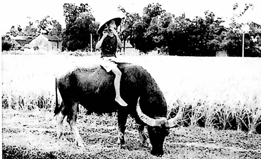
Chăn trâu ở quê