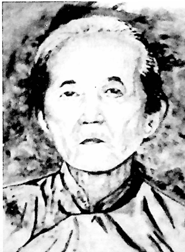
Người má vĩ đại của tác giả