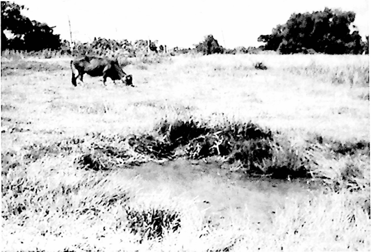
Vũng trâu nằm

trợn ngược, miệng nhe nanh, lưỡi dò le ra dài sọc, trông rất ghê rợn trong mắt trẻ thơ như tôi hồi nhỏ. Nhưng hình tượng ông Tiêu thu hút nhiều người đến xem, trong đó có tôi. Chùa Hang, được xây dựng trên núi thấp nhưng có một giếng nước trong veo mà một lần giữa năm sáu mươi của thế kỷ trước, người ta đồn đoán Phật Bà Quan Âm hiển linh ban nước cam lồ, chữa được bá bệnh nan y. Do đó, thập phương bá tánh từ các nơi ùn ùn kéo về xin nước thánh, gây nên cảnh hỗn độn, xe cộ ùn ứ cả chục cây số.