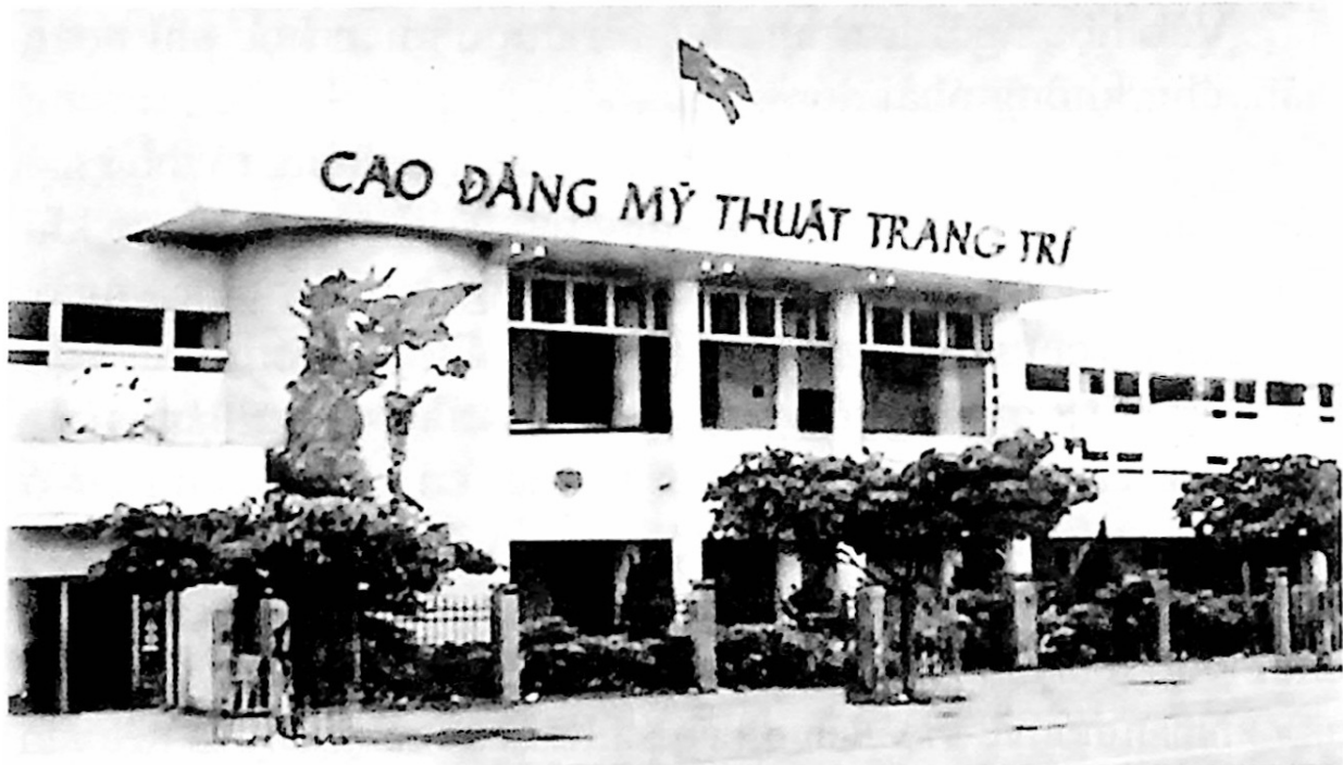
Trường Cao đẳng Mỹ thuật Trang trí Đồng Nai (Tiền thân là Trường Bá nghệ Biên Hòa)

nhân văn theo đạo lý “Uống nước nhớ nguồn”. Cúng tiên sư được hiểu là cúng Đức Khổng Tử, người được thiên hạ tôn vinh là “Vạn thế sư biểu”, nghĩa là ông thầy tiêu biểu của muôn đời. Cũng có thể hiểu là cúng những người thầy đầu tiên dạy chữ, dạy nghề cho mình. Trong phòng truyền thống của nhà trường có bàn thờ tiên sư để tưởng nhớ các thế hệ thầy cô từ thời thành lập trường hồi đầu thế kỷ XX, cho đến sau này đã khuất. Hàng năm, đúng vào ngày 1/1 dương lịch, quý thầy cô đương chức, nghỉ hưu cùng các thế hệ học sinh, sinh viên tề tựu về trước bàn tiên sư để túc yết những thầy cô đã dạy dỗ mình nên người. Các thầy giáo của tôi như thầy Ngôn, thầy Ninh, thầy Bích, thầy Minh, thầy Răn, thầy Thông... lần lượt quy tiên. Các thế hệ đàn anh và bạn bè của tôi cũng ngày càng thưa thớt với tuổi tác ngày càng già đi, nhiều người đã hóa ra người thiên cô. Quy luật cuộc đời là như vậy, có ai cưỡng lại được đâu.