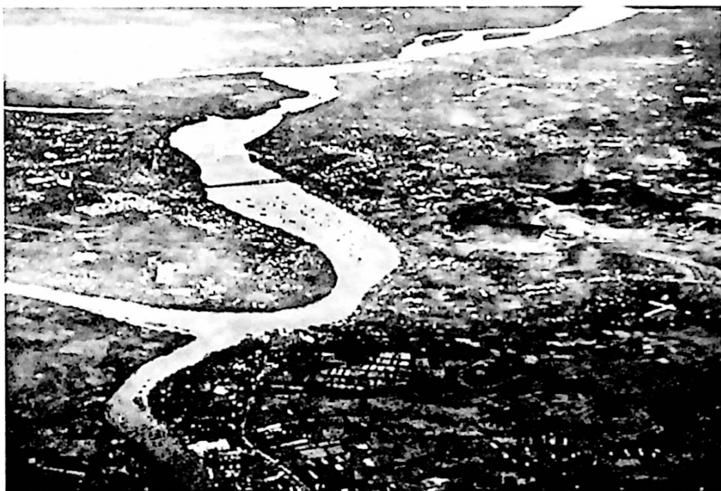
Sông Đông Nai nhìn từ trên cao

tụ khí” nên mang lễ đến xin hương chức trong làng, cho họ được cải táng đem hài cốt ông bà từ nhị tỳ Phúc Kiến ở núi Châu Thới về gò Rùa an táng. Nếu hương chức trong làng đồng ý, họ sẽ bỏ chi phí trùng tu lại ngôi chùa Khánh Sơn cổ tự và đúc một chiếc đại hồng chung tiến cúng cho nhà chùa, nhưng các già làng không đồng ý, mặc dù chùa đã xuống cấp, dân quá nghèo không thể đóng góp để trùng tu. Bởi vì từ trước đến nay, chưa có ai được phép an táng trên gò Rùa, dù là người có công trạng lớn đối với làng chặng nữa. Gọi là gò Rùa vì trên cù lao được hình thành từ phù sa cổ, phù sa mới, nhưng lại nổi lên hai quả đồi lớn, nhỏ bằng đá ong liền nhau, cao khoảng 20m, có dáng trông như hình con Quy đang bơi về hướng Tây Bắc.